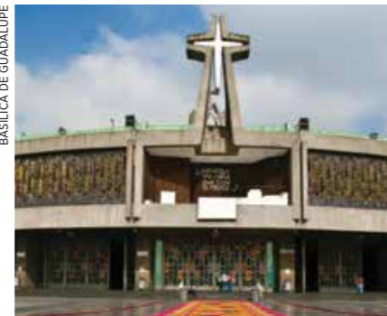
BASÍLICA DE GUADALUPE

La Basílica de Guadalupe http://youtu.be/hSsmTvkSjNY honra a la patrona de México, la Virgen Morena que, de acuerdo con la tradición, se le apareció a Juan Diego en 1551. La gran fiesta del templo es el 12 de diciembre, cuando se convierte en un lugar de peregrinaje para millones de devotos, muchos de los cuales todavía llegan en bicicleta o a pie desde sitios remotos. Vendedores que ofrecen objetos de devoción abarrotan el barrio, y todavía se aprecia el