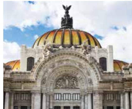
PALACIO DE BELLAS ARTES

Acueducto de Guadalupe , construido en el siglo XVIII. El Instituto Politécnico Nacional alberga el Planetario Luis Enrique Erro http://youtu.be/5ZAUbzjPAbE donde puedes descubrir el universo de manera didáctica con la ayuda de tecnología de punta. En el recinto hay un mural que narra la historia de la astronomía. Una visita al Zoológico San Juan de Aragón incluye, además de diversas especies animales, actividades recreativas.