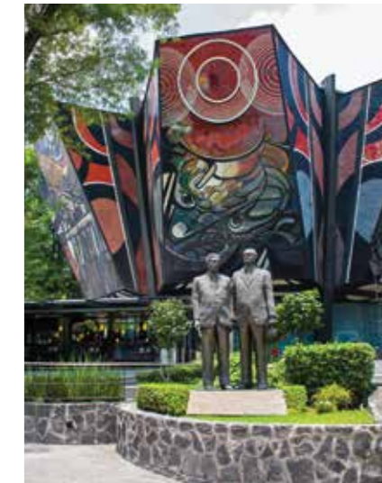
POLYFORUM CULTURAL SIQUEIROS

En el centro de la delegación, que aún conserva sus aires de tranquilo pueblo de estilo colonial, se encuentra el Jardín Hidalgo . Enfrente está la Parroquia de los Apóstoles Felipe y Santiago , antiguo monasterio dominico. La Casa de Cultura , famosa por sus hermosos jardines, alberga exposiciones temporales de arte, y el interior de la cercana Biblioteca Fray Bartolomé de las Casas tiene un fantástico mural de Juan O'Gorman. Tras recorrer la zona, dirígete a una de las cantinas más antiguas de la ciudad, El Dux de Venecia , para tomar un trago acompañado por deliciosas botanas. Inspirado en los jardines de los gobernantes aztecas a la orilla del lago de Texcoco, el Parque Tezozómoc cuenta con un teatro al aire libre, juegos infantiles y senderos para