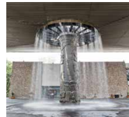
MUSEO NACIONAL DE ANTROPOLOGÍA

El Bosque de Chapultepec aloja algunos de los museos más importantes, como el Museo Nacional de Antropología , con una vasta colección de objetos de la historia del país; el Museo de Arte Moderno , con una retrospectiva permanente del arte mexicano del siglo XX; el Museo Tamayo , que expone arte contemporáneo, y el Papalote Museo del Niño , un mundo de maravillas. El parque se divide en tres secciones y cuenta con un zoológico , el Castillo de Chapultepec —que alberga el Museo Nacional de Historia —, el Museo de Historia Natural de la Ciudad de México y un gran lago con renta de lanchas. En Polanco encontrarás las más prestigiosas boutiques de artículos de lujo sobre la calle Presidente Masaryk, además de galerías de arte, como la Sala de Arte Público Siqueiros , y algunos de los mejores restaurantes de la ciudad, mientras