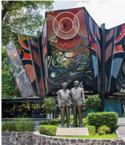
西盖罗斯多功能馆

大区中心为 伊达尔戈花园（Jardín Hidalgo） ，花园内矗立着墨西哥独立运动的英雄伊达尔戈的雕像，并仍然保存着殖民时期的乡村风情，远离喧嚣。雕像对面是 圣徒费利佩与圣地亚哥教堂（Parroquia de los Apóstoles Felipe y Santiago） ，一座古老的多米尼克教堂；以美丽的小花园装点的 文化之家（Casa de Cultura） 常有艺术展； 德拉斯卡萨斯图书馆（Biblioteca Fray Bartolomé de las Casas） 内胡安·奥格曼的壁画令人称奇…… 参观之后，你可以到墨城最古老的酒馆之一—— 威尼斯王酒馆（El Dux de Venecia） 品