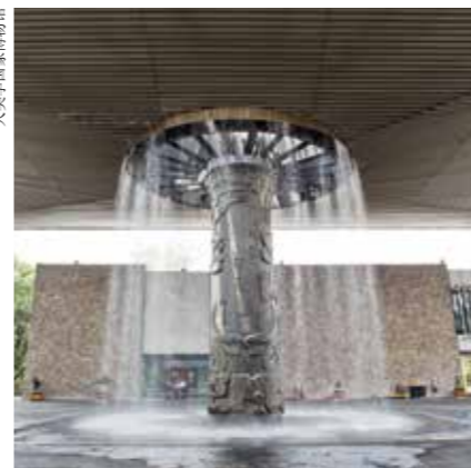
人类学国家博物馆

本区以纪念耶稣受难这一宗教活动闻名全墨西哥，该活动于每年圣周的周五在埃斯特拉雅山（La Estrella）山顶举行，重现耶稣受难之景象。最近山顶上有了考古新发现，发现的文物均收藏在山上的新火博物馆（Museo del Fuego Nuevo）里。山顶上提供导游服务。山坡上的库尔瓦坎老修道院（Ex Convento de Culhuacán）建于1607年，原是托尔特克文明时期的一座堡垒，修道院有前西班牙时期的神像和雕塑。新维加（La Nueva Viga）海鲜市场是世界上最大的海鲜市场之一，早晨有导游服务，售卖的海鲜种类让人叹为观止。奎特拉华克公园（Parque Cuitláhuac）也值得一看。请