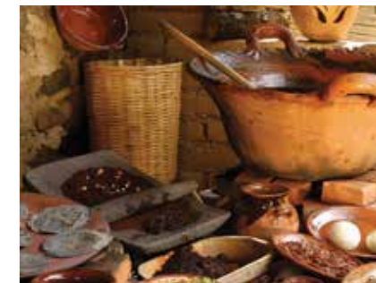
FOIRE DU MOLE