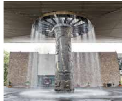
MUSEO NACIONAL DE ANTROPOLOGIA

Dans l'enceinte du Bosque de Chapultepec sont implantés quelques-uns des plus importants musées du Mexique : le Museo Nacional de Antropología , qui abrite une vaste collection d'objets historiques et d'œuvres d'art ; le Museo de Arte moderno et sa rétrospective permanente de l'art mexicain du XX e siècle ; le Museo Tamayo , qui expose des œuvres d'art contemporain ; sans oublier le Palote Museo del Niño et son monde merveilleux destiné aux enfants. Le parc du Bosque de Chapultepec est divisé en trois grandes sections incluant un zoo , le Castillo de Chapultepec - qui abrite le Museo Nacional de Historia -, le Museo de Historia Natural de México , ainsi qu'un grand lac (location de barques). Le quartier de Polanco est connu pour ses prestigieuses boutiques de luxe, installées le long de la rue Presidente Masaryk, ses nombreuses galeries d'art, comme la