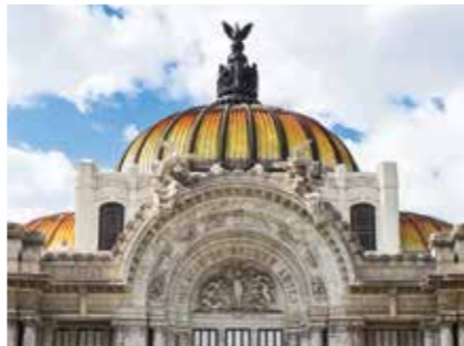
PALACIO DE BELLAS ARTES

L' Institut polytechnique National abrite le Planétarium Luis Enrique Erro http://youtu.be/5ZAUbzIPAbE qui permet de découvrir l'univers de manière didactique à l'aide d'une technologie de pointe. On peut également y admirer une peinture murale illustrant l'histoire de l'astronomie. Le Zoo San Juan de Aragón héberge une grande variété d'espèces animales, et offre différentes activités récréatives.