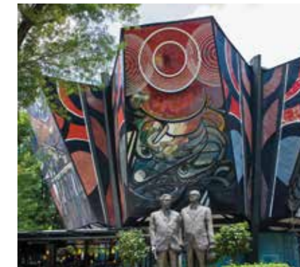
POLYFORUM CULTURAL SIQUEIROS

Au cœur de cet arrondissement, qui a conservé son charme de paisible village colonial, se trouve le Jardín Hidalgo , face à la Parroquia de los Apóstoles Felipe y Santiago , un ancien monastère dominicain. La Casa de Cultura , connue pour ses magnifiques jardins, accueille des expositions temporaires. Non loin de là, la Bibliothèque Fray Bartolomé de las Casas abrite une superbe fresque de Juan O'Gorman. Après une bonne promenade, on peut faire une pause dans l'une des plus anciennes « cantinas » de la ville, El Dux de Venecia , pour y boire un verre accompagné de délicieux amuse-gueule. Inspiré des jardins des empereurs aztèques qui bordaient le lac de Texcoco, le Parc Te-