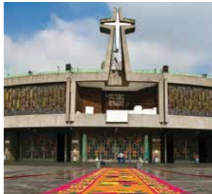
БАЗИЛИКА ДЕВЫ МАРИИ ГВАДАЛУПСКОЙ

ка Сан-Хуан-де-Арагон вы можете не только увидеть различные виды животных, но также посетить некоторые аттракционы.