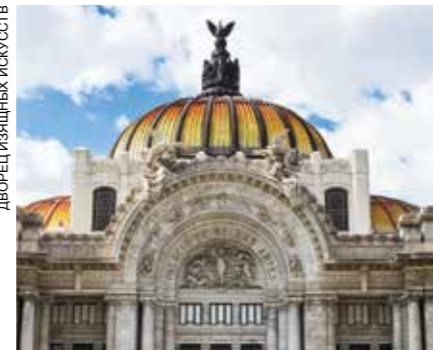
ДВОРЕЦ ИЗЯЩНЫХ ИСКУССТВ

Базилика Девы Марии Гвадалупской http://youtu.be/hsSsmivKsNY была построена в честь покровительницы Мексики Темнокожей Девы, которая согласно традиции предстала перед Хуаном Диего в 1551 году. Большой праздник храма отмечают каждый год 12 декабря, когда район превращается в место паломничества миллионов прихожан, многие из которых приезжают на велосипеде или приходят пешком из удаленных поселений. Окружающие площади заполняются продавцами религиозных сувениров. До сих пор сохранился Акведук Гвадалупы построенный в XVIII веке, который снабжал район питьевой водой. В Национальном Политехническом Институте с его Планетарием Луиса Энрике Ерро http://youtu.be/5ZAubziPAbE можно открыть для себя вселенную в дидактической манере с помощью современной технологии. Вдобавок здесь есть монументальная фреска, рассказывающая историю астрономии. Во время визита Зоопарк